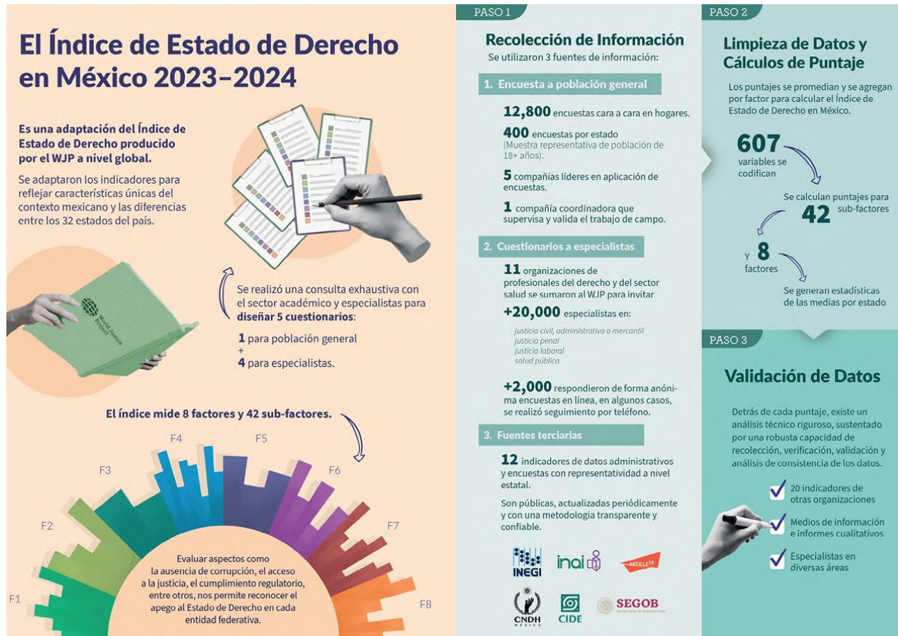
Figura 1. Índice de Estado de Derecho en México 2023-2024

Fuente: World Justice Project. Índice de Estado de Derecho 2023-2024