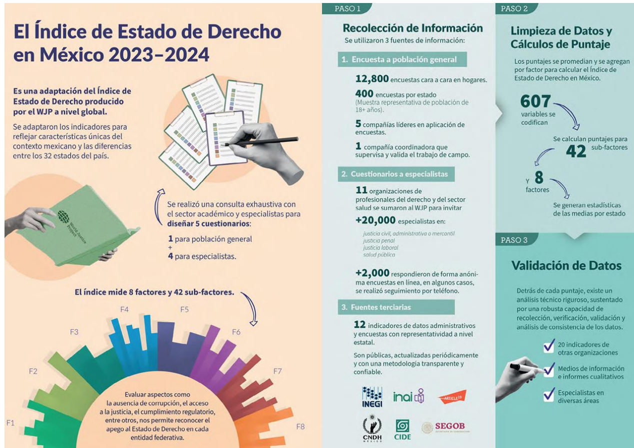
Figura 1. Índice de Estado de Derecho en México 2023-2024

Fuente: World Justice Project. Índice de Estado de Derecho 2023-2024